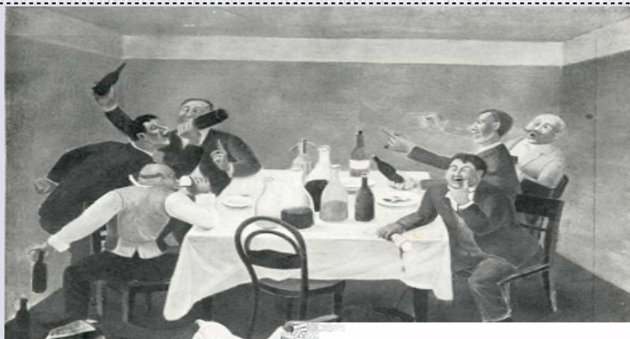
Izložba Udruženja umjetnika Zemlja, Zagreb, 1929.